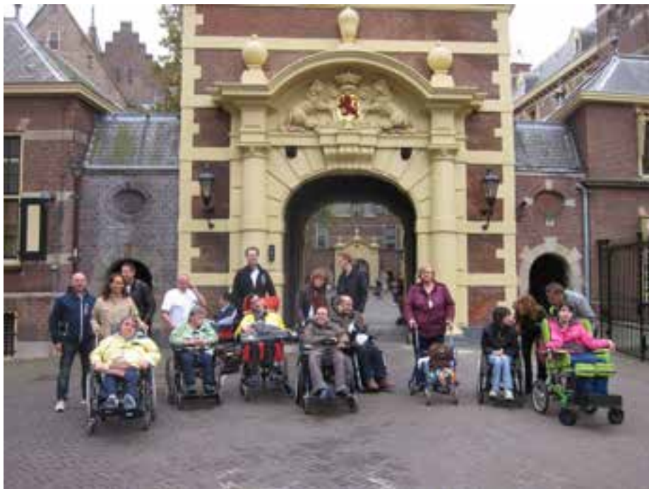
De cliënten van Middin op pad.