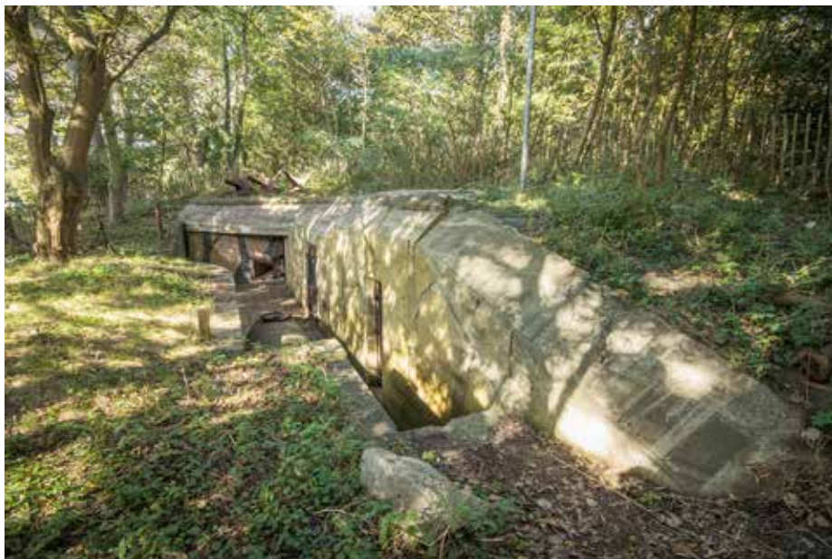
Duitse commandobunker van het type 608 (Bataillon, Abteilung oder Regiments Gefechtsstand) aan de Badhuisweg

De Stichting Atlantikwall Museum Scheveningen (SAMS) is sinds september 2008 gevestigd in een drietal bunkers aan de Badhuisweg. Hier is de voormalige commandobunker van de Stützpunktgruppe Scheveningen ingericht als museum. In deze bunker, met drie meter dikke gewapend betonnen muren en dak, kan men een indruk krijgen hoe de Duitse soldaten leefden. Volledig voorbereid op de eindstrijd die nooit kwam, met continu de dreiging van Geallieerde luchtaanvallen. Tevens is in de bunker een uitgebreide collectie gebruiksvoorwerpen uit de bezettingstijd tentoongesteld. In 2013 is het museum op de Badhuisweg uitgebreid met een grote commandobunker waar in de toekomst wisselende tentoonstellingen te zien zullen zijn. Op dit moment wordt er op een andere locatie in Den Haag gewerkt aan het uitgraven en het herstellen van een ondergrondse gangen- bunkercomplex waar vanaf 2015 rondleidingen zullen worden gegeven. Op deze manier wil de stichting de geschiedenis in de regio Haaglanden aan de hand van de historische militaire restanten waar mogelijk beleefbaar maken. Dit om de geschiedenis over oorlog maar