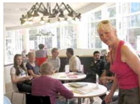
Finy in haar SamenSprakcafé.

‘Daarnaast hebben we een Leeskring voor anderstaligen opgezet. Zo’n vier keer per jaar komen maximaal 10 koppels in de Centrale Bibliotheek bijeen om met elkaar aan de hand van een lesbrief een speciaal voor anderstali-