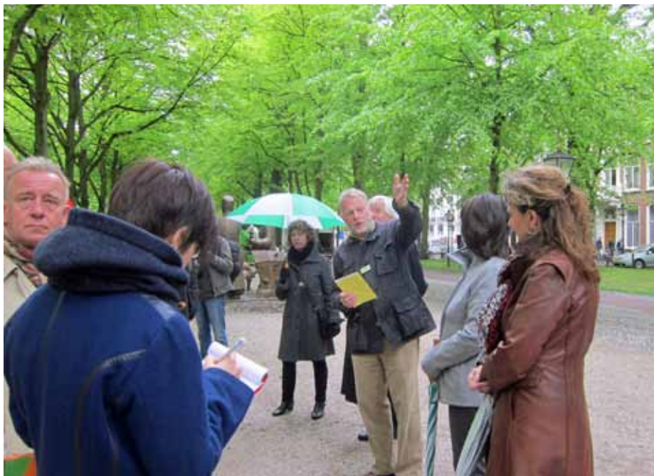
Ook de pers was aanwezig.