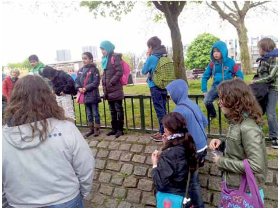
Genoeg aandacht van de leerlingen voor de Schilderswijk.

'Den Haag ontmoet Den Haag' is een project waarbij de leerlingen van basisscholen uit de diverse wijken van Den Haag kennis maken met elkaar. Het doel is elkaar en de verschillende culturen te leren kennen en daarbij niet alleen de overeenkomsten te zien maar ook de verschillen en daar respect voor te hebben. Een van de ontmoetingen zou zijn in de vorm van een stadswandeling door de Schilderswijk. Daarbij heb ik hulp ingeroepen van het Gilde Den Haag. Wat een fantastische keuze is dat geweest! De organisatie van de wandeling heeft in en kort tijdsbestek plaatsgevonden en om dat mogelijk te maken heeft het Gilde zich enorm ingezet om gidsen te krijgen en de wandeling aan te passen aan onze wensen.