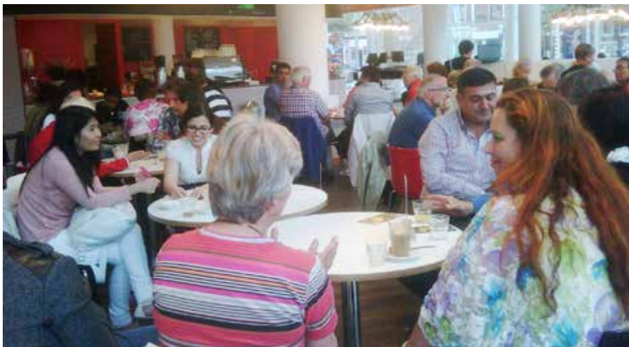
SamenSprak Café in de bibliotheek.

voor het doen van de intakes, het onderhouden van de contacten met de taalkoppels, het maken van koppelingen en het registreren voor de in totaal ongeveer 40 koppels die in deze regio wonen.