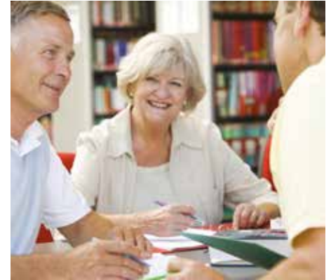
Gilde Individueel advies

Over 'kern' gesproken: onze kernactiviteit is Kennisoverdracht. Onze vrijwilligers hebben kennis op velerlei gebied in huis, en dat willen zij graag belangeloos delen. 'Belangeloos' moet hier vooral in materiële zin worden opgevat, geen vergoeding van de uren die aan de vrijwillige inzet worden besteed. Wist u trouwens dat van de 5,4 miljoen vrijwilligers in Nederland niet meer dan 6,5% zo'n materiële vergoeding ontvangt? Zelfs 'belangeloos' is niet het juiste woord, want de vrijwilliger die zonder prijskaartje zijn kennis deelt krijgt er veel voor terug: waardering, zelfvertrou-